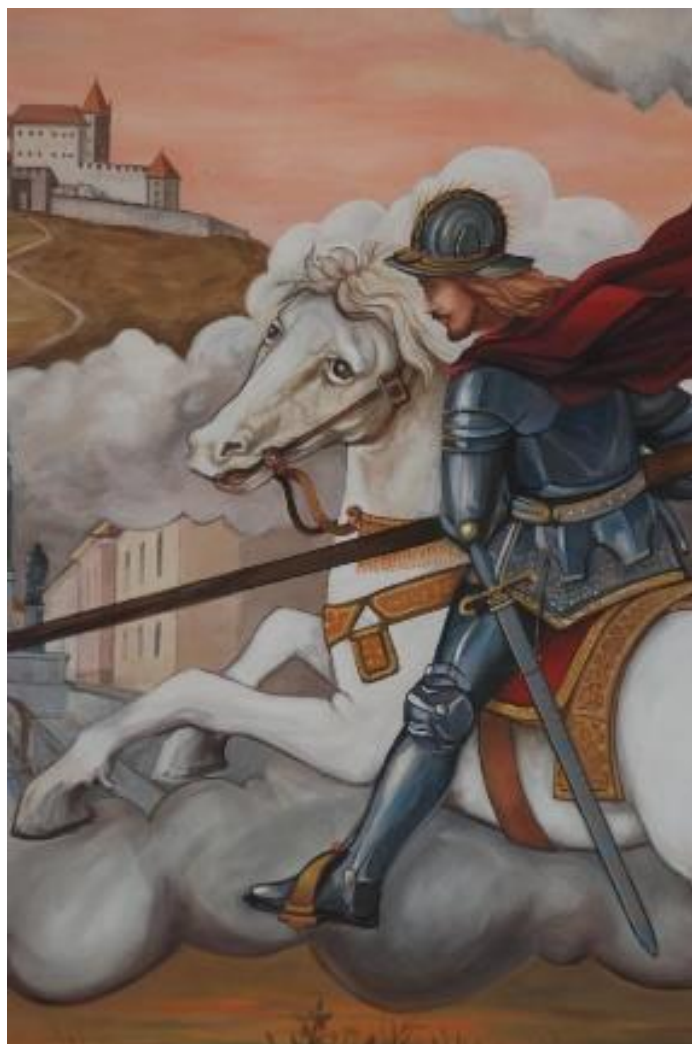
Freska svetega Jurija

Naše babice in dedki še danes radi pripovedujejo o tem, da je Konjiška gora znotraj votla. V njej je nekoč valovilo mogočno gorsko jezero, v katerem je živel zmaj, ki je rjovel in divjal po jezeru. Ljudje, ki so živeli ob vznožju gore, so se zaradi nemirnega zmaja začeli bati, da bi se gora razpočila, ter da bi voda zalila njihove domove in rodovitna polja.